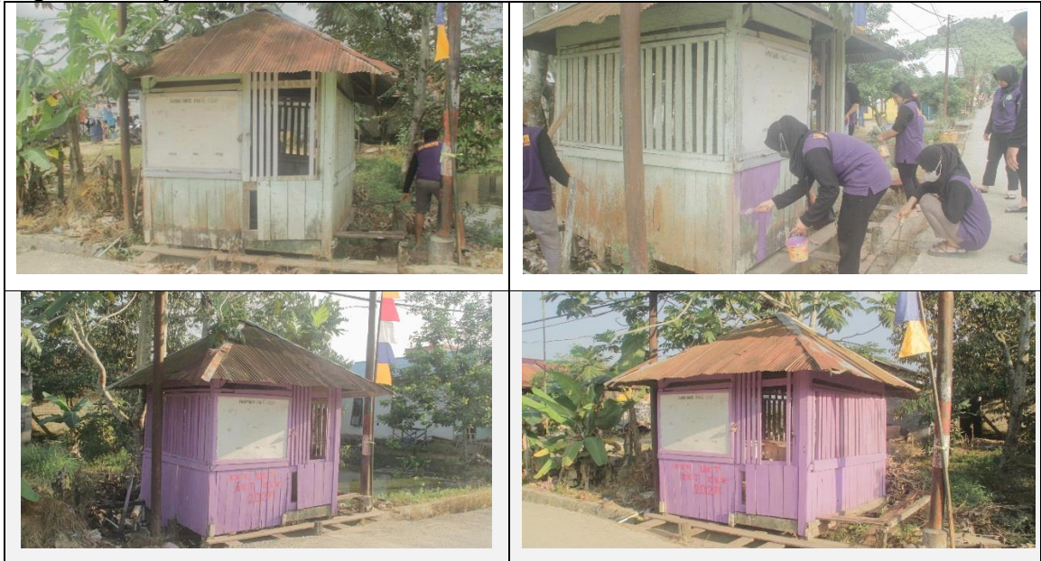
Gambar 8 Kegiatan Perbaikan Pos Kamling dan Pengecatan

Program Perbaikan POS Kamling dan Pengecatan adalah program yang sudah ditetapkan sebagai program ke empat dalam kegiatan KKN angkatan 30 Universitas Kutai Kartanegara yang berlokasi di KM.04 Dusun Tegal Anyar, Gg. Cinta Ratu, RT.05 dengan tujuan Kegiatan ini dilakukan untuk memperbaiki pos siskamling sehingga terlihat indah dan nyaman ditempati. Perbaikan Pos Kamling dan Pengecatan dapat dilihat pada Gambar 8. Capaian program dalam pembersihan dan pengecatan jembatan adalah 100% dengan persentase kegiatan 100%. Hambatan Program kurangnya bahan cat dan cuaca hujan yang tidak menentu membuat pengecatan menjadi terhambat.