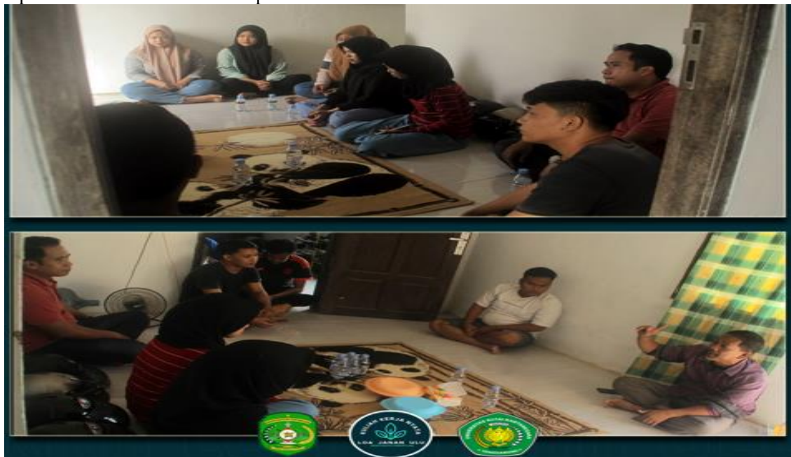
Gambar 2 persiapan kegiatan bersama DPL

hubungan baik antara perguruan tinggi dengan pemerintah kecamatan, pemerintah desa, dan masyarakat secara langsung. Pengetahuan tentang Keadaan Geografis dan Demografi, pengetahuan tentang Kebudayaan, pengetahuan tentang organisasi kemasyarakatan yang ada serta pendidikan dan kesehatan dapat dilihat Gambar 2.