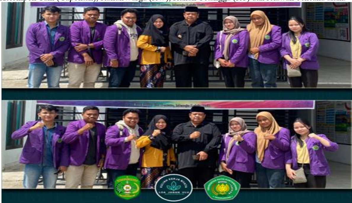
Gambar 2 Kepala Desa Loa Janan Ulu

Tahap kedua adalah menyusun program kerja bersama Dosen Pendamping Lapangan (DPL) yaitu mempersiapkan semua materi, bahan atau alat yang akan digunakan. Perencanaan program kerja pengabdian bersama Kepala Desa Loa Janan Ulu dapat dilihat pada Gambar 2. Pengetahuan tentang organisasi kemasyarakatan juga perlu diketahui yang dibentuk oleh masyarakat. Organisasi sosial berfungsi sebagai sarana partisipasi masyarakat dalam pembangunan bangsa dan negara. Dalam sosiologi, organisasi sosial adalah pola hubungan antara dan di antara individu dan kelompok sosial. Lembaga sosial di antaranya adalah BPD, PKK, Karang Taruna, Lembaga Pemberdayaan Masyarakat (LPM), Kelompok Sadar Wisata (Pokdarwis), Gabungan Kelompok Tani (Gapoktan), Rukun Warga (RW), Rukun Tetangga (RT) dan relawan bencana alam.