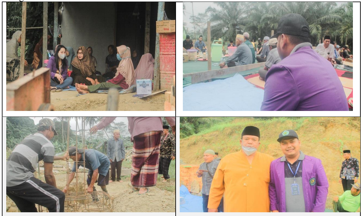
Gambar 11 Peletakan Batu Pertama Pembangunan Pondok Pesantren

Program Peletakan batu Pertama Pembangunan Pondok Pesantren adalah program tambahan dalam kegiatan KKN angkatan 30 Universitas Kutai Kartanegara yang berlokasi di KM .04 Dusun Tegal Anyar, Gg. Cinta Ratu, RT.05 dengan tujuan Untuk membantu masyarakat sekitar membangun pondok pesantren dilingkungan tersebut. Capaian program dalam Peletakan batu Pertama Pembangunan Pondok Pesantren adalah 100% dengan persentase kegiatan 100%.