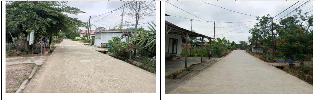
Gambar 5 Penghijauan

Program Penghijauan adalah program yang sudah ditetapkan sebagai program utama dalam kegiatan KKN angkatan 30 Universitas Kutai Kartanegara yang berlokasi di KM .04 Dusun Tegal Anyar, Gg. Cinta Ratu, RT.05 dengan tujuan untuk melestarikan lingkungan, agar lingkungan kembali asri dan sehat tanpa pencemaran di wilayah tersebut, pada awal program sudah dilakukan komunikasi kepada aparatur desa dalam hal ini kepala Dusun Tegal Anyar, untuk penanaman bisa dilakukan di lingkungan RT.05 Gg. Cinta Ratu, awal proses penyusunan lokasi penanaman mendapat antusias yang baik dari masyarakat desa dengan catatan penanaman pohon buah. sedangkan untuk penanaman pohon hutan, masyarakat kurang setuju dikarenakan lokasi yang akan dilakukan penanaman kurang cocok untuk pohon tahunan, seperti pada Gambar 5. Capaian program Rata-rata capaian program adalah 20% dengan persentase kegiatan yang masing-masing adalah 20%. Hambatan Program Tidak tersedianya bibit pohon buah yang diawalnya sudah disusun sebagai program penghijauan di lingkungan Dusun Tegal Anyar.