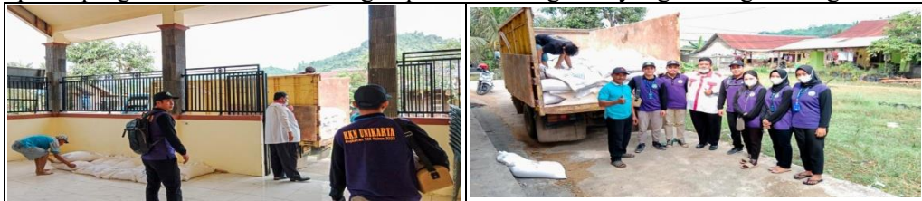
Gambar 6 Kegiatan Bantuan Pupuk

Program bantuan pupuk adalah program tambahan yang pada saat kelompok KKN angkatan 30 Universitas Kutai Kartanegara yang berlokasi di KM .04 Dusun Tegal Anyar, Gg. Cinta Ratu, RT.05 dengan tujuan Membantu memantau dan menyalurkan bantuan pupuk dari kantor Desa Loa Janan Ulu ke masyarakat, pada proses penyaluran bantuan, kami diikutsertakan untuk mendokumentasikan kegiatan tersebut dapat dilihat pada Gambar 6. Capaian program Rata-rata capaian program adalah 100% dengan persentase kegiatan yang masing-masing adalah 100%.