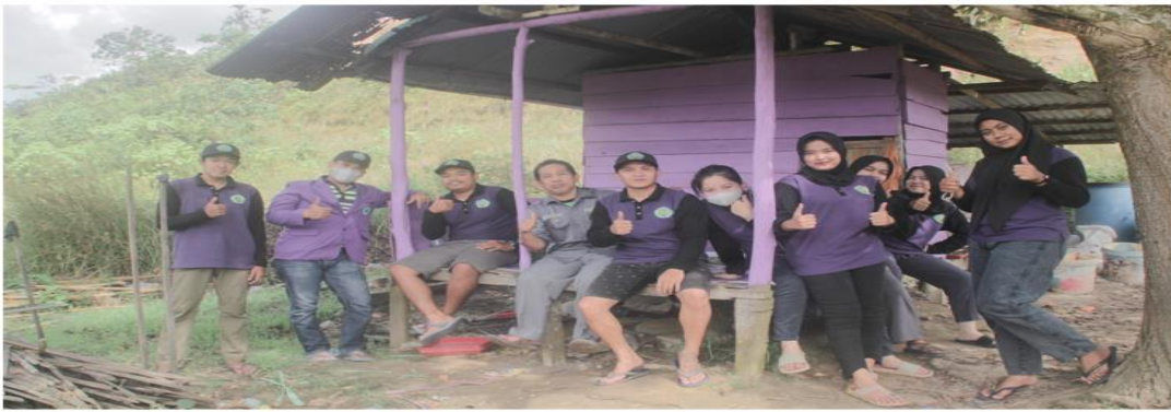
Gambar 3 Observasi lokasi tempat pengembangan kebun etam

Tahapan ketiga adalah observasi atau penjajagan lokasi tempat pengembangan. Sasaran observasi desa meliputi, geografis daerah lokasi pengabdian, potensi dan hal lain yang dipandang perlu dan menunjang pembangunan desa. Hal yang pertama dilakukan adalah mengidentifikasi masalah yang ada di Desa tersebut, sehingga dapat lebih mendalam dan terarah dalam melaksanakan program kerja yang telah disusun. Pengamatan secara langsung ke lokasi pengabdian sekaligus melakukan wawancara terhadap aparat desa maupun masyarakat umum dalam upaya untuk memperoleh data yang akurat tentang desa tersebut yang disesuaikan dengan situasi dan kondisi desa. Observasi Lapangan dapat dilihat pada Gambar 3. Termasuk letak geografis dan demografi desa serta batas desa, pendidikan dan kesehatan serta budaya yang ada dan sebagainya.