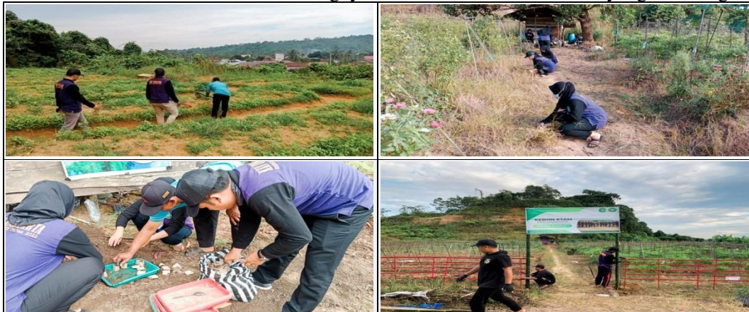
Gambar 4. Kebun Etam

Program Kebun Etam adalah program yang sudah ditetapkan sebagai program utama dalam kegiatan KKN angkatan 30 Universitas Kutai Kartanegara yang berlokasi di KM.04 Dusun Tegal Anyar dengan tujuan untuk pemberdayaan masyarakat dalam mengembangkan perkebunan dan bisa dijadikan contoh untuk kedepannya. Pengecekan awal lokasi kebun etam, dilakukan pengecekan kadar PH tanah bertujuan untuk mengetahui kesuburan tanah dan Tanaman apa saja yang cocok untuk ditanam dan membersihkan lokasi kebun etam. Kelompok dibagi menjadi 2 bagian, satu kelompok difokuskan untuk membersihkan lokasi kebun sebelum dilakukan penanaman dan untuk kelompok kedua difokuskan untuk membuat pagar supaya dalam hal masyarakat yang melihat bisa mengetahui bahwa tempat tersebut dijadikan tempat sampel pembuatan kebun etam. Kelompok KKN melakukan proses pemupukan dan penyemaian bibit yang akan ditanam antara lain, bibit Labu madu, Buncis, Tomat dan Lombok. Kebun Etam yang disajikan dalam Gambar 4. Capaian program Capaian program dalam pembuatan kebun etam adalah 100% dengan persentase kegiatan 100%. Hambatan Program Kurangnya Pupuk untuk kesuburan tanah dan tanaman dan kurangnya obat-obatan untuk tanaman yang terserang hama.