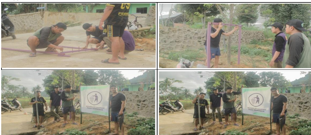
Gambar 9 Perbaikan BAK Sampah

Program Perbaikan Bak Sampah adalah program yang sudah ditetapkan sebagai program tambahan dalam kegiatan KKN angkatan 30 Universitas Kutai Kartanegara yang berlokasi di KM .04 Dusun Tegal Anyar, Gg. Cinta Ratu, RT.05 dengan tujuan agar memudahkan petugas untuk melakukan pengambilan dan memberikan kebersihan untuk lingkungan desa agar masyarakat desa tidak membuang sampah sembarangan. Capaian program dalam pembersihan dan pengecatan jembatan adalah 100% dengan persentase kegiatan 100%. Hambatan Program 1. Kurangnya material seperti kayu, paku untuk memperbanyak tempat sampah di lingkungan RT.05.