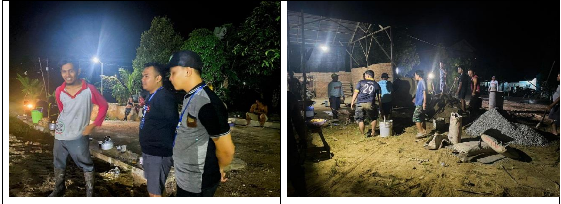
Gambar. Pembangunan Lapangan Badminton dan Tenis Meja

Olahraga dan bertepatan untuk kegiatan lomba 17 Agustus 2022. pada proses pembangunan tempat Badminton, masyarakat bergotong rotong untuk menyelesaikan pembangunan lapangan sampai selesai. Capaian program dalam pembersihan dan pengecatan jembatan adalah 100% dengan persentase kegiatan 100%.