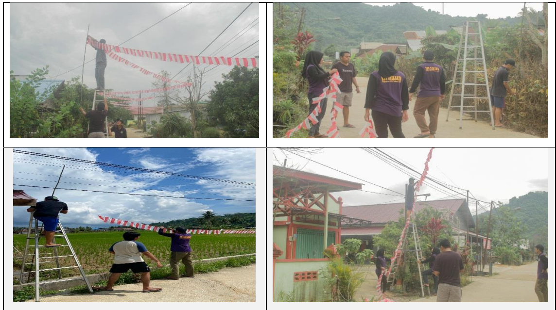
Gambar 10 Pemasangan Bendera Merah Putih Bulan Agustus

ke 77 dapat dilihat Gambar 10. Capaian program dalam pembersihan dan pengecatan jembatan adalah 100% dengan persentase kegiatan 100%.