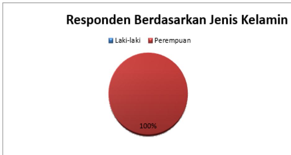
Gambar 3. Karakteristik Responden Berdasarkan Jenis Kelamin

Mayoritas konsumen cabai rawit merah di Pasar Mangkurawang yang didominasi oleh ibu rumah tangga sebesar 70% . Hal ini diduga karena konsumsi responden merupakan konsumen akhir yang membeli cabai rawit untuk kebutuhan rumah tangga.