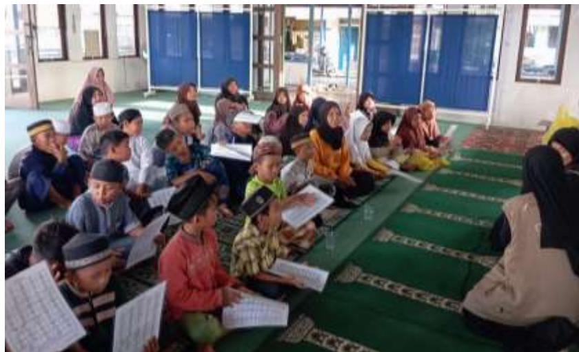
Gambar 2 Kegiatan Gema

Pada awalnya sebelum kegiatan dimulai, terlebih dahulu mahasiswa KKN melakukan observasi yang kemudian di diskusikan dengan Ustadz dan Ustadzah disekitar untuk melakukan bimbingan terkait dengan tajwid. Adapun respon yang didapat yaitu anak-anak antusias dalam mengikuti GEMA. Kegiatan GEMA dilaksanakan secara rutin setiap sore setelah sholat asar. Kegiatan ini terbuka bagi anak-anak Desa Embalut yang ingin belajar seperti mengaji, menambah pengetahuan tentang tajwid dan lain sebagainya. Kegiatannya tidak hanya dilakukan di posko KKN tetapi juga di setiap TPA yang ada di Desa Embalut.