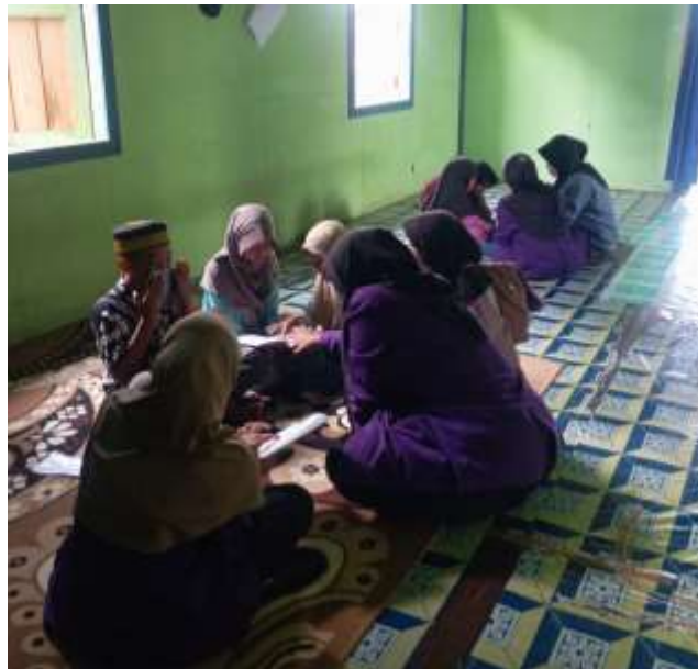
Gambar 4 Kegiatan Gema

Dalam pelaksanaan pembelajaran, mahasiswa KKN bertindak sebagai pembimbing yang mengarahkan peserta dalam membaca Al-Qur'an serta memperbaiki kesalahan bacaan secara langsung. Setiap kesalahan diperbaiki melalui pemberian contoh yang tepat dan penjelasan yang mudah dipahami. Pendekatan ini memungkinkan peserta merasa nyaman dan terdorong untuk aktif membaca tanpa rasa takut melakukan kesalahan. Seiring berjalannya kegiatan, terlihat adanya peningkatan kemampuan peserta dalam melafalkan huruf hijaiyah, mengatur panjang-pendek bacaan, serta menerapkan hukum tajwid secara lebih konsisten.