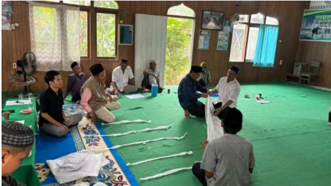
Gambar 4. Praktik mengkafani jenazah: penyiapan kain kafan dan teknik pengikatan.