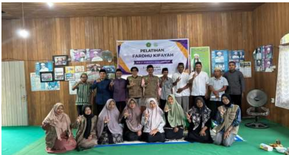
Gambar 7. Foto bersama peserta, mitra, dan tim pelaksana setelah pelatihan.