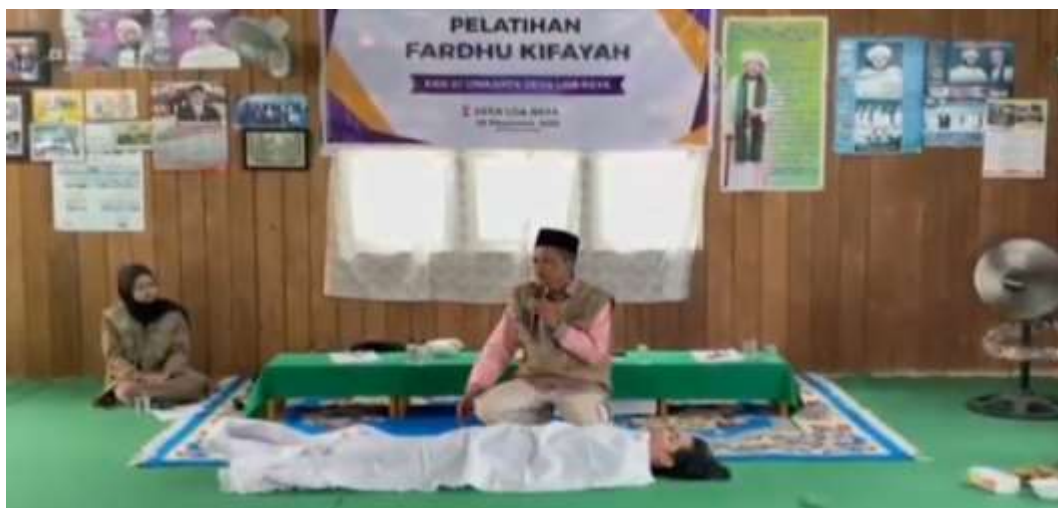
Gambar 5. Suasana praktik mengkafani jenazah secara partisipatif