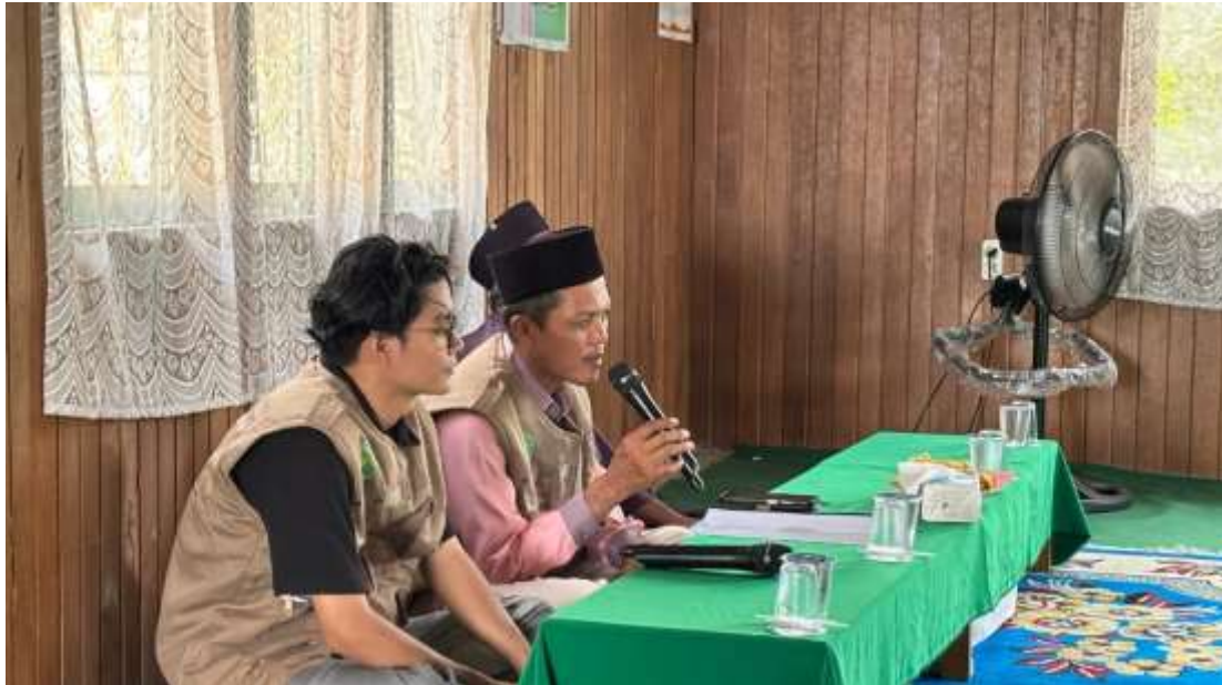
Gambar 2. Penyampaian materi dan diskusi fardhu kifayah oleh pemateri.