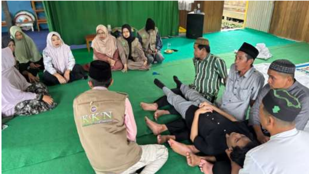
Gambar 3. Praktik memandikan jenazah (simulasi) dengan pendampingan pemateri dan mitra.