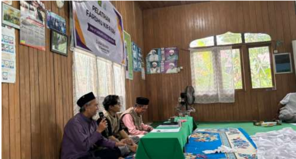
Gambar 6. Penutupan kegiatan oleh mitra (Pengurus Fardhu Kifayah Desa Loa Raya).