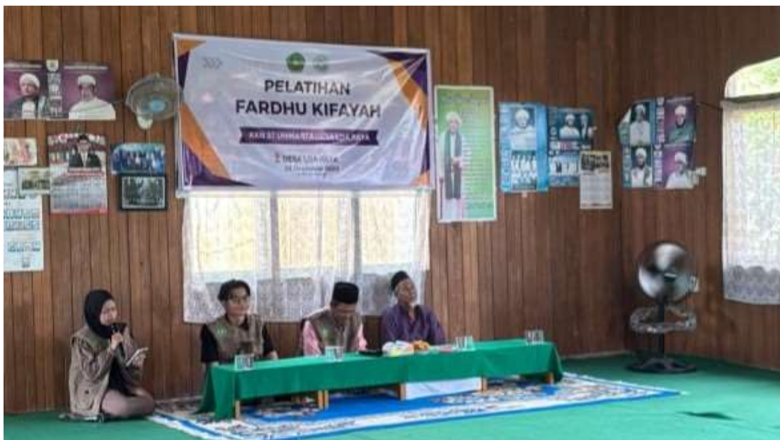
Gambar 1. Pembukaan pelatihan fardhu kifayah di Sekretariat Fardhu Kifayah RT 02 Desa Loa Raya.

Rangkaian kegiatan dimulai dengan pembukaan dan sambutan mitra, dilanjutkan penyampaian materi teori serta diskusi (Gambar 1 dan Gambar 2). Diskusi berjalan aktif karena sebagian peserta khususnya laki-laki telah memiliki pengalaman mendampingi pengurusan jenazah, sehingga muncul proses sharing terkait kebiasaan lokal yang sedikit berbeda dengan penjelasan pemateri. Perbedaan ini tidak menjadi hambatan, tetapi justru menjadi ruang klarifikasi dan penguatan pemahaman bahwa praktik yang berkembang di masyarakat perlu tetap mengacu pada kaidah syariat, sementara variasi teknis yang tidak bertentangan dapat ditoleransi sesuai konteks setempat.