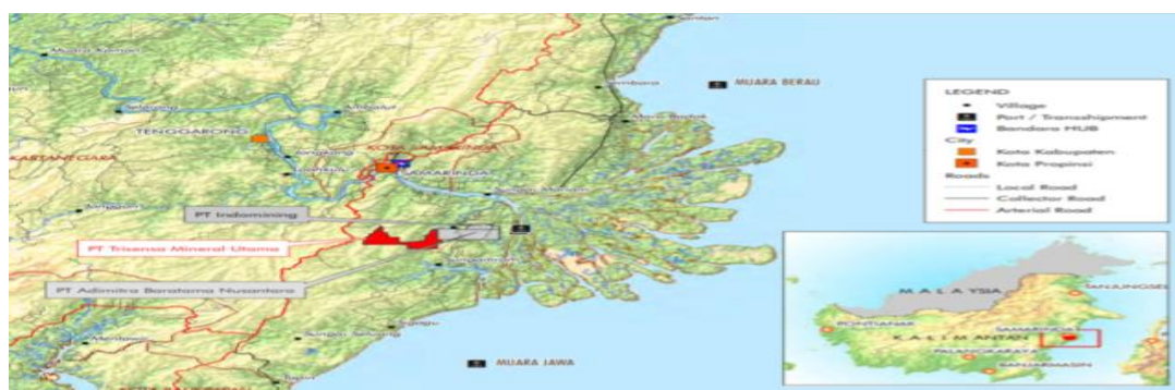
Gambar 1. Lokasi Penambangan PT TMU