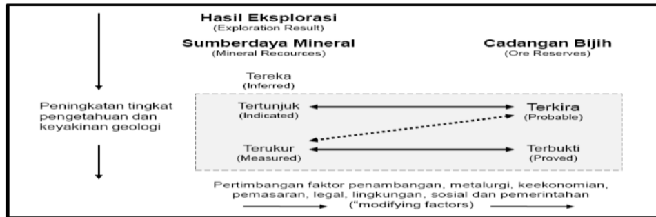
Gambar 1. Hubungan antara Hasil Eksplorasi, Sumberdaya Mineral dan Cadangan Bijih

Dalam perhitungan estimasi sumberdaya mengacu pada Standar Nasional Indonesia (SNI): 5015 mengenai batubara dan Kode Komite (bersama) Cadangan Mineral Indonesia (Kode KCMi 2011).